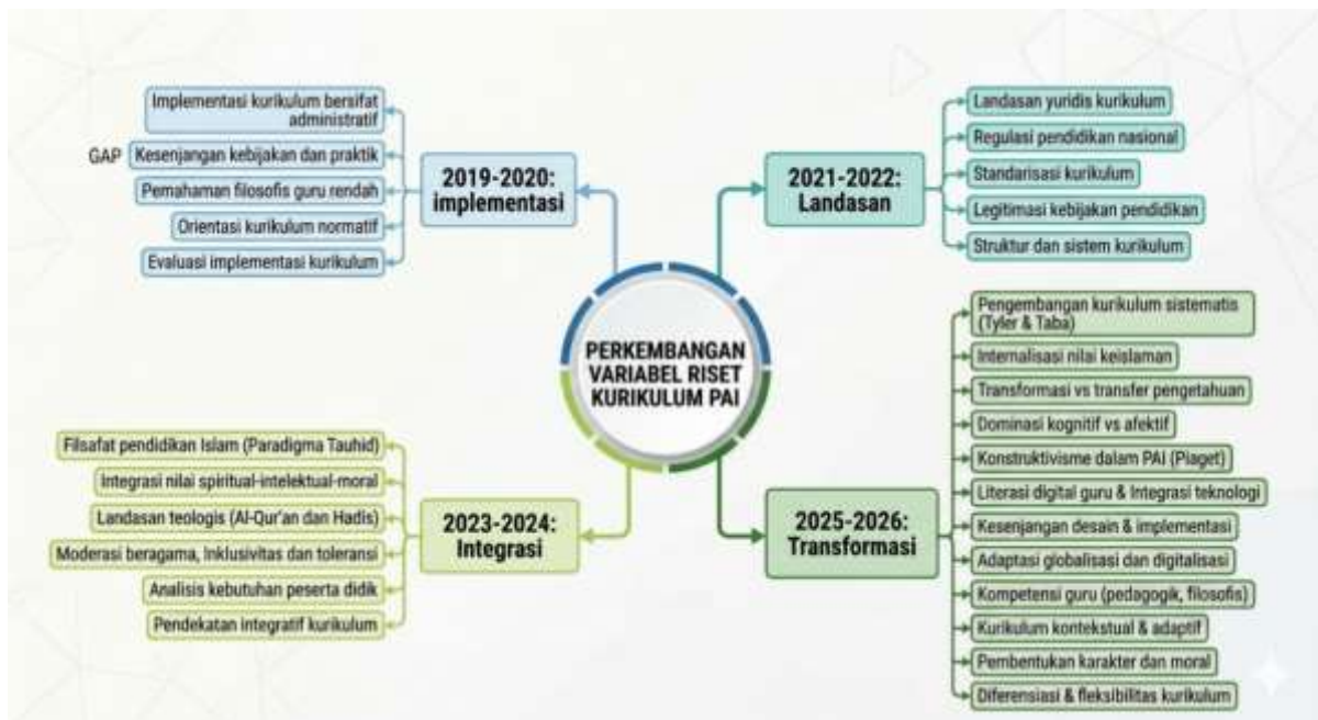
Gambar 2. Transformasi Paradigma Riset Kurikulum PAI: Era Administratif ke Digital

mencerminkan belum optimalnya respons terhadap perkembangan teknologi. Di sisi lain, kompleksitas tantangan sosial menuntut pendekatan kurikulum yang lebih inklusif dan kontekstual agar PAI tidak hanya berfungsi sebagai sarana transfer ajaran, tetapi juga sebagai media pembentukan sikap moderat dalam kehidupan beragama. Meskipun pembahasan ini telah mengidentifikasi berbagai tantangan secara komprehensif dari aspek pedagogis, teknologi, dan sosial, analisis yang disajikan masih cenderung deskriptif dan belum mendalami hubungan sebab-akibat antarpermasalahan. Selain itu, solusi yang ditawarkan masih bersifat umum, seperti peningkatan kompetensi guru, tanpa disertai strategi implementatif yang konkret, sehingga akan lebih kuat apabila dilengkapi dengan contoh praktik baik atau model implementasi yang aplikatif.