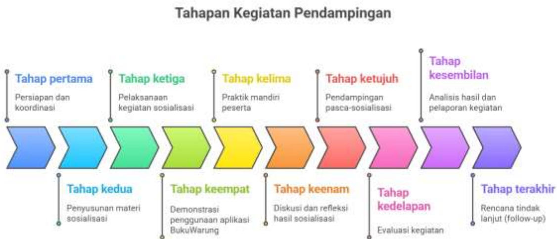
Gambar 1. Tahapan Kegiatan Pendampingan

Kegiatan pengabdian kepada masyarakat ini dilaksanakan dengan menggunakan pendekatan partisipatif, di mana tim pelaksana dan mitra UMKM berperan aktif dalam seluruh tahapan kegiatan. Pendekatan ini dipilih agar proses pendampingan tidak hanya bersifat satu arah, tetapi membangun interaksi dua arah yang memungkinkan pelaku usaha memahami secara praktis manfaat dari pembukuan digital (Fibrina & Andriani, n.d.). Kegiatan difokuskan pada pengenalan dan pendampingan penggunaan aplikasi BukuWarung sebagai solusi pembukuan sederhana berbasis digital yang sesuai dengan kebutuhan operasional Rumah Makan Prasmanan Emmy Saelan. Berikut ini adalah tahapan pelaksanaan pendampingan yang dilakukan, yaitu :