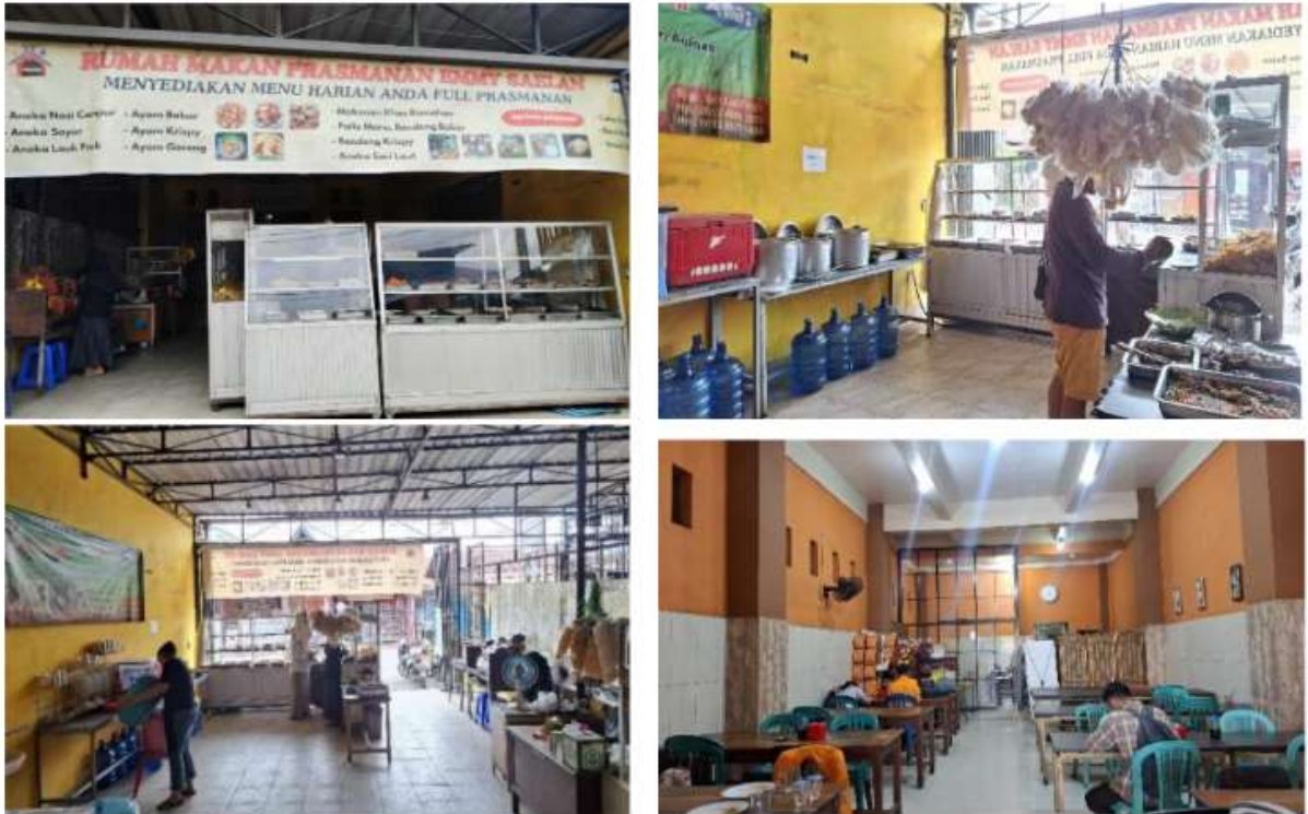
Gambar 2. Observasi

antara pengeluaran pribadi dan usaha. Temuan ini menjadi dasar penyusunan materi sosialisasi agar sesuai dengan konteks dan kemampuan mitra.