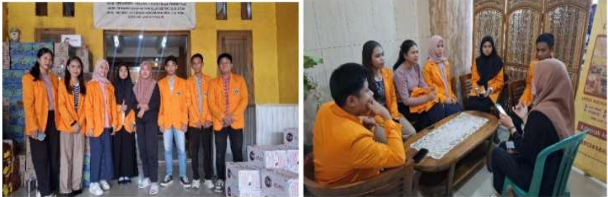
Gambar 3. Sosialisasi

Creative Commons - Attribution 4.0 International - CC BY 4.0