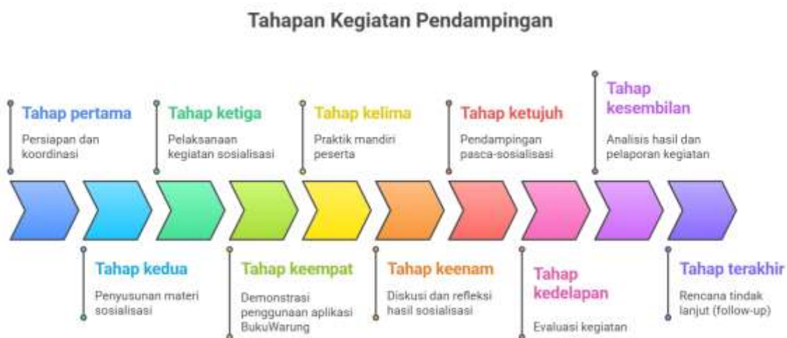
Gambar 1. Tahapan Kegiatan Pendampingan

Kegiatan pengabdian kepada masyarakat ini dilaksanakan dengan menggunakan pendekatan partisipatif, di mana tim pelaksana dan mitra UMKM berperan aktif dalam seluruh tahapan kegiatan. Pendekatan ini dipilih agar proses pendampingan tidak hanya bersifat satu arah, tetapi membangun interaksi dua arah yang memungkinkan pelaku usaha memahami secara praktis manfaat dari pembukuan digital (Fibrina & Andriani, n.d.). Kegiatan difokuskan pada pengenalan dan pendampingan penggunaan aplikasi BukuWarung sebagai solusi pembukuan sederhana berbasis digital yang sesuai dengan kebutuhan operasional Rumah Makan Prasmanan Emmy Saelan. Berikut ini adalah tahapan pelaksanaan pendampingan yang dilakukan, yaitu :