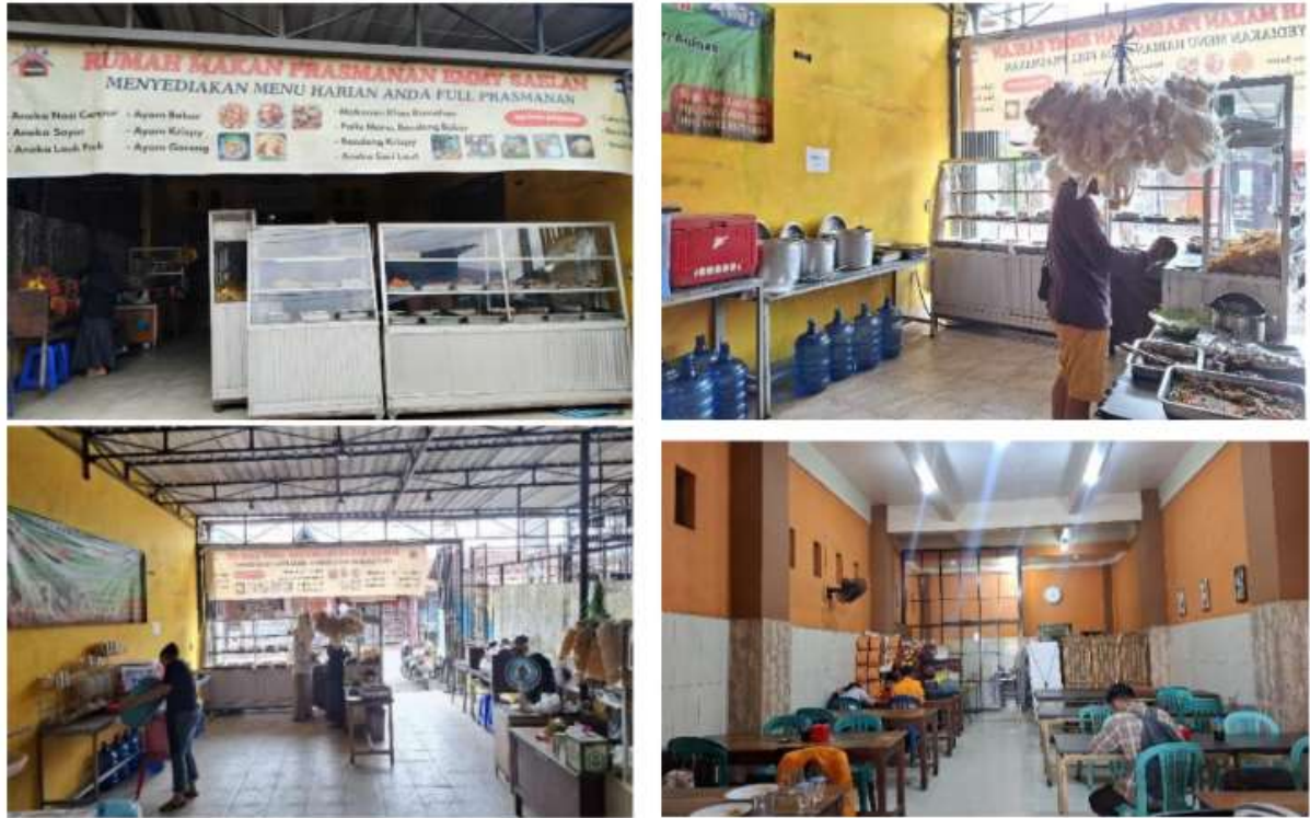
Gambar 2. Observasi

antara pengeluaran pribadi dan usaha. Temuan ini menjadi dasar penyusunan materi sosialisasi agar sesuai dengan konteks dan kemampuan mitra.