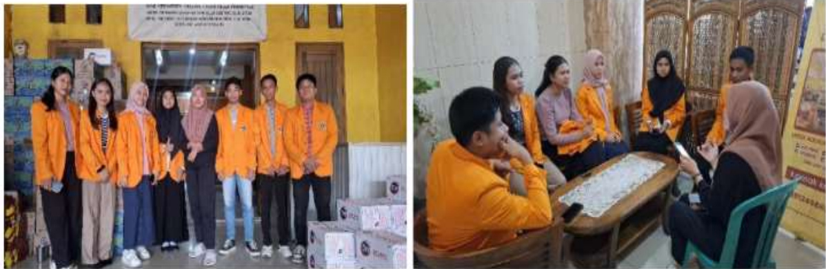
Gambar 3. Sosialisasi

Creative Commons - Attribution 4.0 International - CC BY 4.0