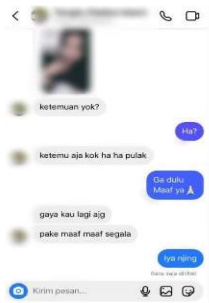
Gambar 2. Tangkapan Layar Direct Message (DM) di Instagram

Dalam konteks ini, perempuan yang aktif di ruang digital, khususnya aktivis perempuan, memiliki kerentanan yang lebih tinggi karena visibilitasnya yang besar. Serangan yang mereka terima tidak hanya bersifat personal, tetapi juga berkaitan dengan identitas gender dan posisi mereka sebagai individu yang vokal. Salah satu bentuk cybermisogyny yang dialami meliputi body shaming , objektifikasi tubuh, hingga pesan langsung ( direct message ) yang bersifat memaksa dan merendahkan.