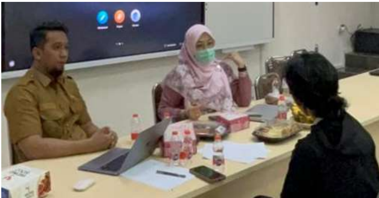
Gambar 2. Rekrutmen Konselor Sebaya

Pelaksanaan kegiatan pengabdian masyarakat ini berlangsung secara sistematis mulai dari tahap persiapan, pelaksanaan intervensi, hingga evaluasi akhir. Pada tahap awal, proses rekrutmen berhasil menjari sebanyak 56 mahasiswa Universitas Negeri Gorontalo yang memenuhi kriteria sebagai calon konselor sebaya. Peserta yang terpilih menunjukkan latar belakang yang beragam baik dari program studi maupun pengalaman organisasi, namun secara umum memiliki kesamaan dalam hal motivasi untuk terlibat dalam isu kesehatan masyarakat, khususnya HIV/AIDS. Kegiatan orientasi awal yang diberikan mampu membangun kesadaran peserta terhadap pentingnya peran konselor sebaya dalam mendukung ODHA, terutama dalam konteks masyarakat yang masih diwarnai stigma dan diskriminasi seperti di Provinsi Gorontalo