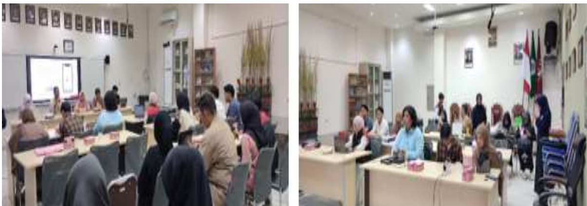
Gambar 4. Kegiatan Seminar Edukasi & Penguatan Kapasitas Konselor

Tahap selanjutnya merupakan inti kegiatan yaitu pelaksanaan seminar dan workshop edukasi yang dilakukan secara intensif di Aula Fakultas Ilmu Pendidikan Universitas Mnegeri Gorontalo. Proses pembelajaran dirancang menggunakan pendekatan andragogi yang menekankan partisipasi aktif peserta. Materi tidak hanya disampaikan dalam bentuk ceramah, tetapi juga diperkaya dengan diskusi interaktif, studi kasus berbasis situasi nyata, serta simulasi peran ( role play ) dalam memberikan konseling kepada ODHA. Melalui pendekatan ini peserta tidak hanya memperoleh pengetahuan kognitif tetapi juga mengalami proses pembelajaran afektif dan psikomotorik. Metode ( role play ) ini dirancang sebagai bagian dari strategi pembelajara partisipatif untuk menjembatani pemahaman teoritis yang telah diperoleh peserta dengan situasi nyata yang akan dihadapi.