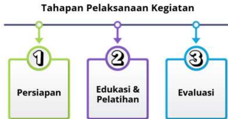
Gambar 1. Tahapan Pelaksanaan

Fakultas Ilmu Pendidikan (FIP) Universitas Negeri Gorontalo, yang dipilih karena representatif dalam mendukung pelaksanaan kegiatan pelatihan secara interaktif dan partisipatif. Tahapan pelaksanaan kegiatan pengabdian ini terdiri atas tiga tahap utama :