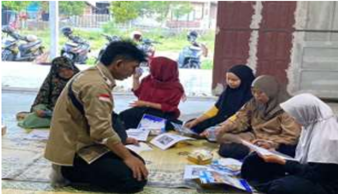
Gambar 1. Pendataan jenis usaha dan diskusi awal kendala yang dihadapi pelaku usaha

dokumen ke platform SIHalal. Pelaku UMKM terlibat aktif dalam setiap tahapan, mulai dari pengisian daftar bahan, pencatatan alur produksi, hingga evaluasi kesiapan dokumen untuk sertifikasi.