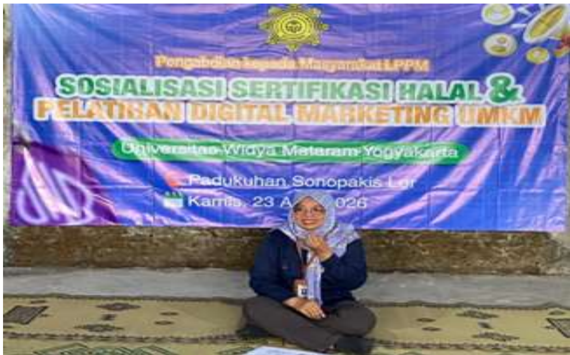
Gambar 2. Kegiatan penyuluhan interaktif tentang konsep halal