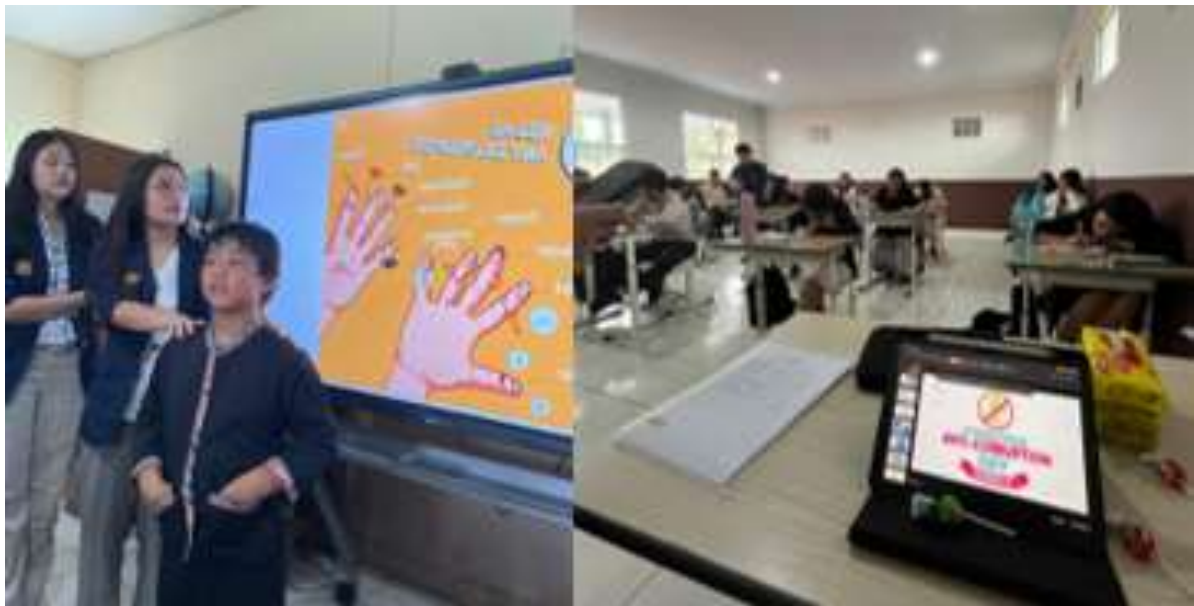
Gambar 4. Pemaparan materi edukasi

Bagis siswa SD kelas 1-6 diadakan kuis sederhana dan relevan pada akhir penyampaian materi dengan tujuan mengukur sejauh mana siswa memahami materi yang baru saja dipelajari, memperkuat ingatan siswa, meningkatkan keterlibatan dan motivasi belajar siswa serta melatih kemampuan berpikir cepat dan kritis.