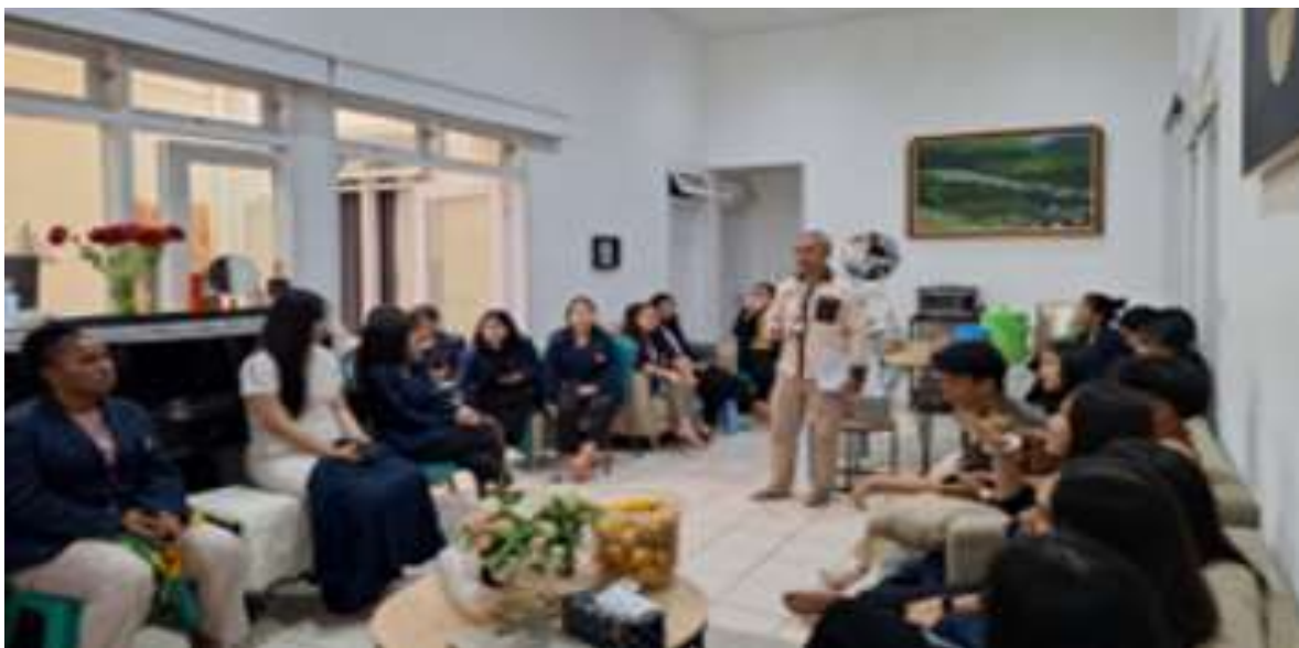
Gambar 8. Evaluasi kegiatan PKM

Setelah selesai melakukan kegiatan PKM, kami langsung mengadakan evaluasi terhadap kegiatan tersebut untuk mengetahui kendala-kendala apa saja yang dihadapi agar kegiatan PKM kedepannya dapat dilakukan lebih baik lagi.