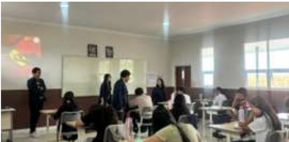
Gambar5. Post-Test terhadap siswa SMP

Bagis siswa SD kelas 1-6 diadakan kuis sederhana dan relevan pada akhir penyampaian materi dengan tujuan mengukur sejauh mana siswa memahami materi yang baru saja dipelajari, memperkuat ingatan siswa, meningkatkan keterlibatan dan motivasi belajar siswa serta melatih kemampuan berpikir cepat dan kritis.