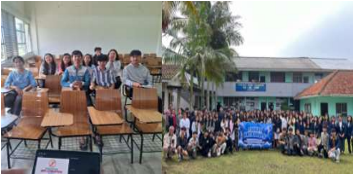
Gambar 2. Tim pengabdian kepada masyarakat bersama siswa SMP PAPAN

informasi mengenai pemahaman siswa tentang korupsi dan memberikan gambaran titik awal (baseline) untuk dibandingkan nanti (Tuti Muryati, 2022)