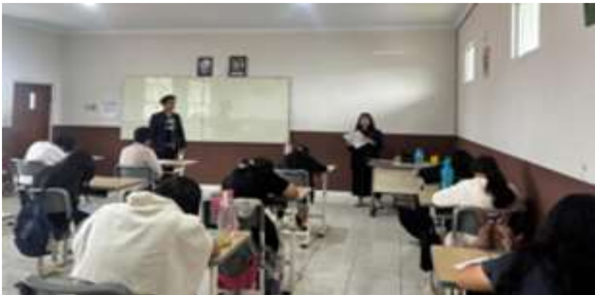
Gambar 3. Pre-test

Pemaparan materi tentang pentingnya pendidikan antikorupsi dengan menanamkan nilai-nilai etika antikorupsi dalam perkembangan peserta didik tingkat SD dan SMP dan secara komunikatif dengan menggunakan media projector LCD, TV Big Screen dan laptop.