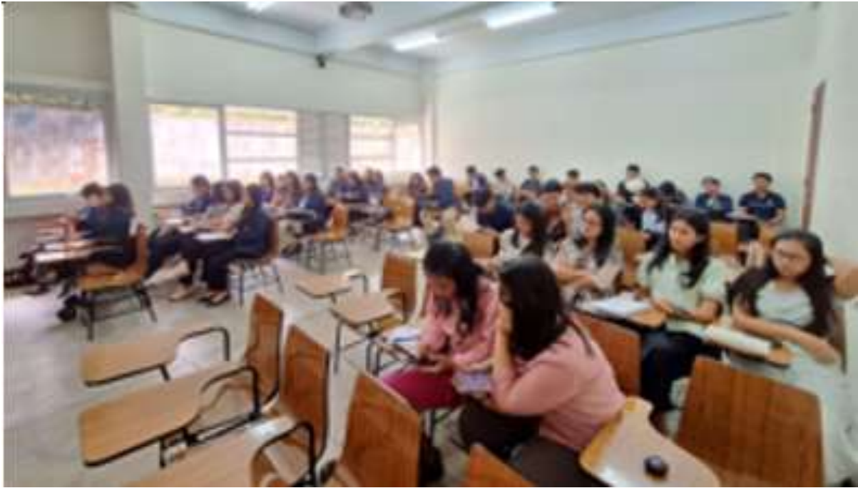
Gambar 1. Diskusi usulan rencana kegiatan pengabdian kepada masyarakat

Adapun materi edukasi yang dibagikan kepada peserta siswa SD meliputi pengertian sederhana mengenai korupsi, contoh perilaku koruptif yang sering dilakukan siswa di sekolah, nilai-nilai antikorupsi, studi kasus sederhana dan relevan, pengukuran pemahaman edukasi dengan kuis. Materi edukasi yang dibagikan kepada peserta siswa SMP meliputi pre-test pemahaman antikorupsi, pengertian korupsi dan dampaknya, teori segitiga penyebab korupsi, contoh perilaku koruptif yang sering dilakukan siswa di sekolah, nilai-nilai antikorupsi, studi kasus sederhana dan relevan dan pengukuran pemahaman edukasi dengan melakukan Post-Test (Pamungkas et al., 2024).