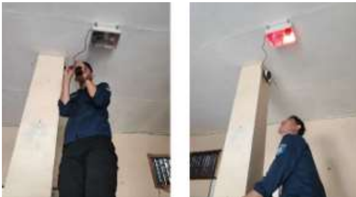
Gambar 2. Proses pemasangan sistem peringatan dini kebakaran berbasis sensor di Kantor Kecamatan Pancalang

Hasil pengujian menunjukkan bahwa sistem peringatan dini dapat berfungsi sebagai alat bantu deteksi awal di lingkungan Kantor Kecamatan Pancalang. Pengujian dilakukan untuk memastikan sensor mampu membaca indikasi bahaya dan alarm dapat memberikan respons peringatan yang dapat dikenali oleh aparat. Temuan ini memperlihatkan bahwa keberhasilan kegiatan tidak hanya terletak pada terpasangnya perangkat, tetapi juga pada kemampuan sistem untuk memberikan sinyal awal yang mendorong aparat melakukan tindakan cepat. Keberadaan alat ini penting karena respons awal pada kebakaran sangat dipengaruhi oleh kecepatan mengenali tanda bahaya dan kemampuan mengambil tindakan yang tepat.