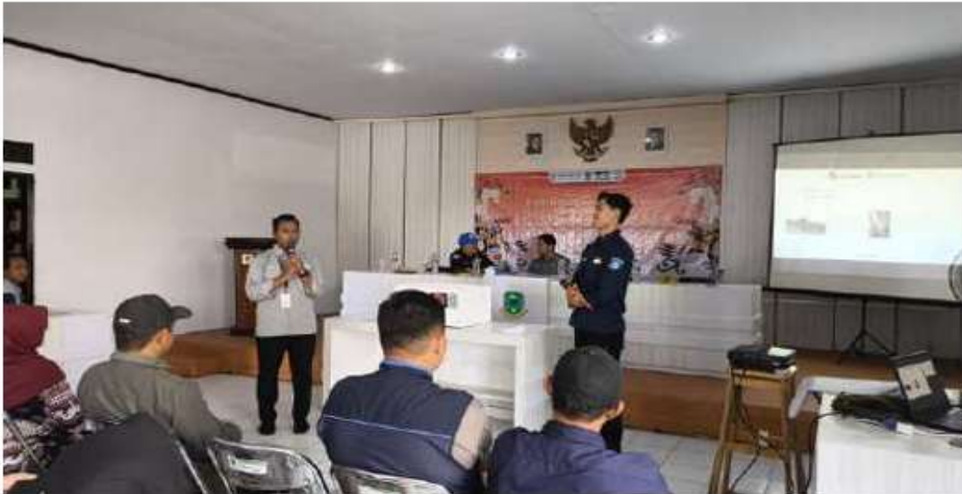
Gambar 3. Penyuluhan mitigasi kebakaran kepada aparaturnya Kecamatan Pancalang

Edukasi mitigasi kebakaran diberikan agar aparaturnya tidak hanya mengetahui keberadaan sistem peringatan dini, tetapi juga memahami langkah pencegahan dan respons awal ketika muncul indikasi bahaya. Pelaksanaan penyuluhan kepada aparaturnya ditampilkan pada Gambar 3.