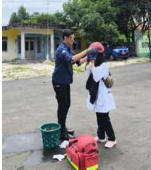
Gambar 4. Simulasi respons awal kebakaran di lingkungan Kantor Kecamatan Pancalang

melalui simulasi kebakaran agar peserta memperoleh pengalaman praktik dalam mengenali peringatan, melakukan koordinasi, dan merespons situasi darurat. Kegiatan simulasi ditampilkan pada Gambar 4.